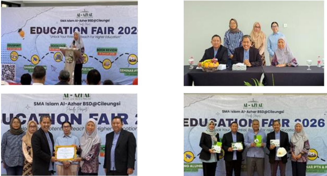
Gambar 4. Kegiatan sosialisasi pengelolaan sampah kepada siswa

Kegiatan ini disambut dengan antusias oleh siswa yang terlihat dari partisipasi aktif dalam sesi diskusi serta kegiatan kuis yang diselenggarakan oleh tim pengabdian. Melalui pendekatan interaktif tersebut, siswa tidak hanya menerima materi secara pasif tetapi juga terlibat aktif dalam proses pembelajaran.