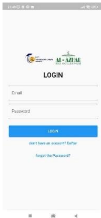
Gambar 1. Tampilan fitur login dan registrasi aplikasi

Fitur ini memungkinkan pengguna untuk membuat akun dan melakukan login sebelum menggunakan aplikasi. Dengan adanya sistem akun pengguna, data pencatatan sampah dapat tersimpan secara personal dan dapat diakses kembali oleh pengguna kapan saja.